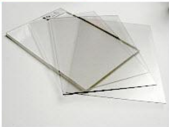
Экструдированное органическое стекло