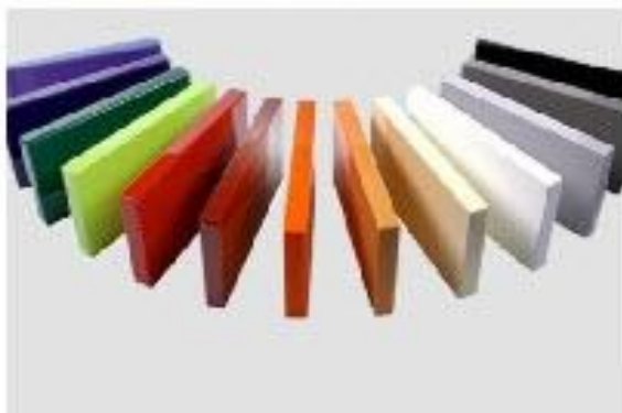
Акриловые листы KAMELLIT и GRANDSILK