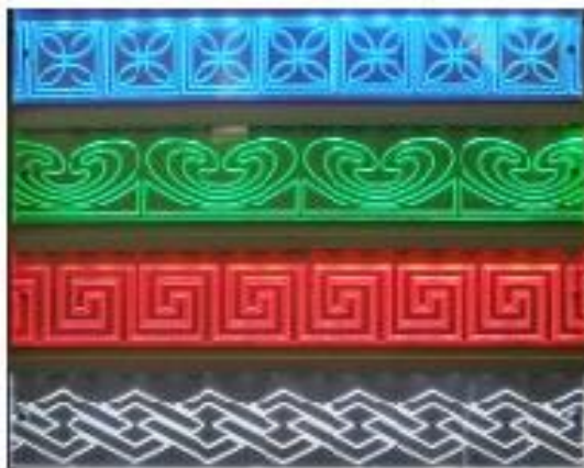
Акриловое стекло для торцевой подсветки