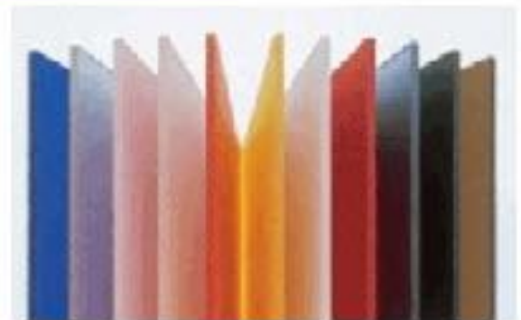
Акриловые листы FRIZZ