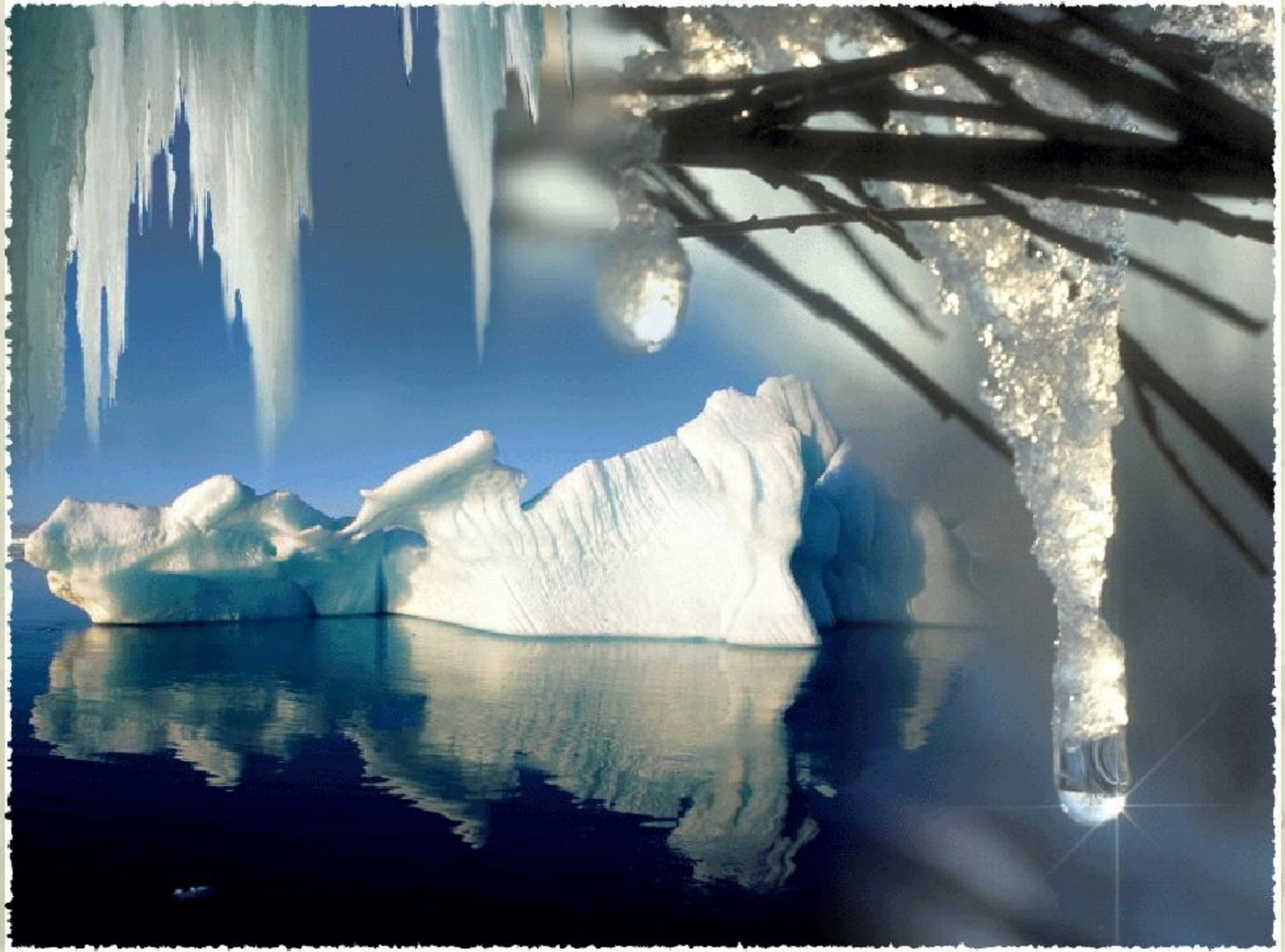
Вода в различных агрегатных состояниях.