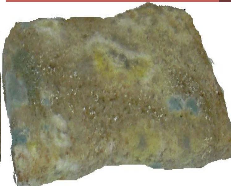
Хлеб находился в смоченном целлофановом пакете