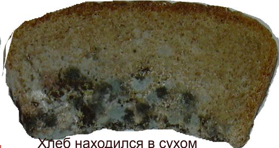
Хлеб находился в сухом целлофановом пакете