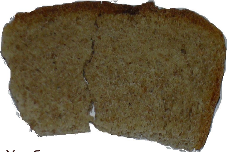
Хлеб находился на тарелке