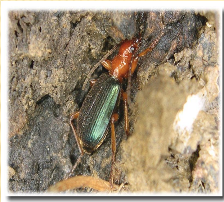
жук-бомбардир Branchynus explodans