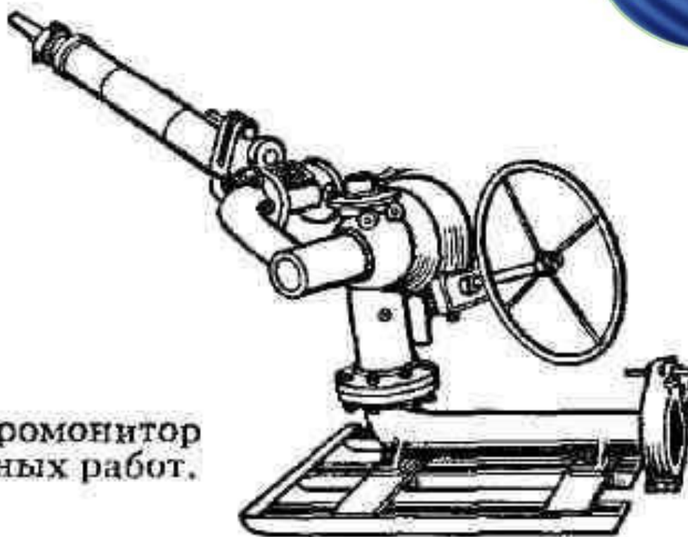
Рис. 2. Гидромонитор для подземных работ.