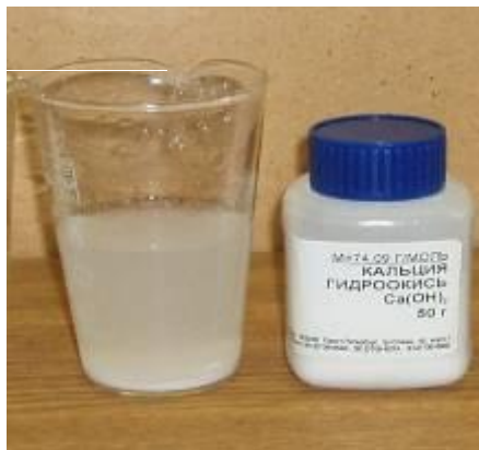
Гидроксид кальция \text{Ca}(\text{OH})_2

малорастворимые (в 100г \text{H}_2\text{O} меньше 1г вещества)