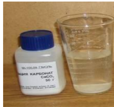
Карбонат кальция \text{CaCO}_3

нерастворимые (в 100г \text{H}_2\text{O} меньше 0,01г вещества)