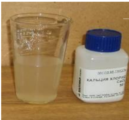
Хлорид кальция \text{CaCl}_2

хорошо растворимые (в 100г \text{H}_2\text{O} больше 1г вещества)