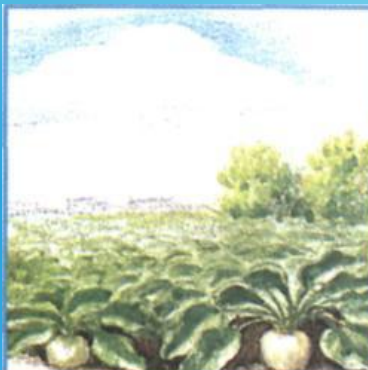
сахарная свёкла и тростник