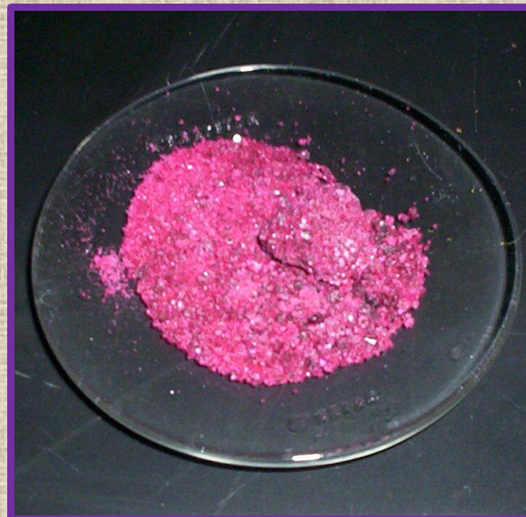
Кристаллогидрат \text{CoCl}_2 \cdot 6 \text{H}_2\text{O}