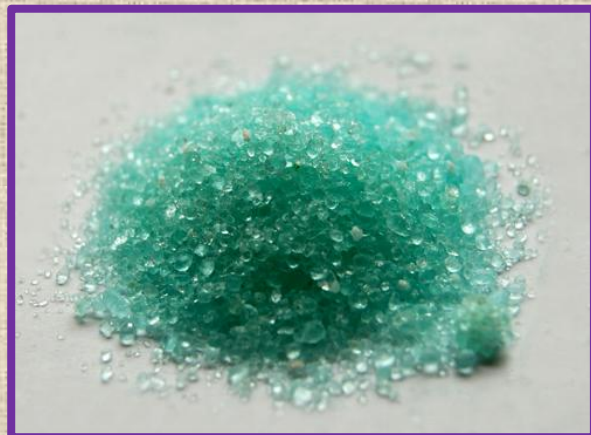
Железный купорос \text{FeSO}_4 \cdot 7 \text{H}_2\text{O}