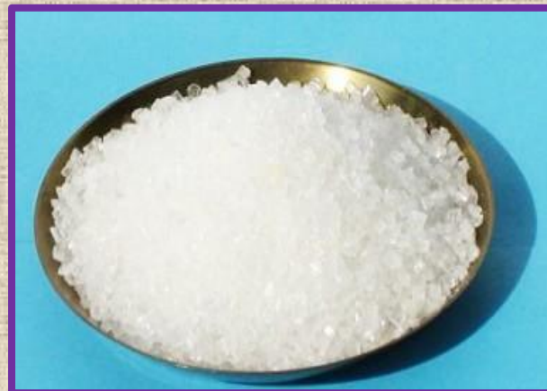
Глауберова соль (мирабилит) \text{Na}_2\text{SO}_4 \cdot 10 \text{H}_2\text{O}