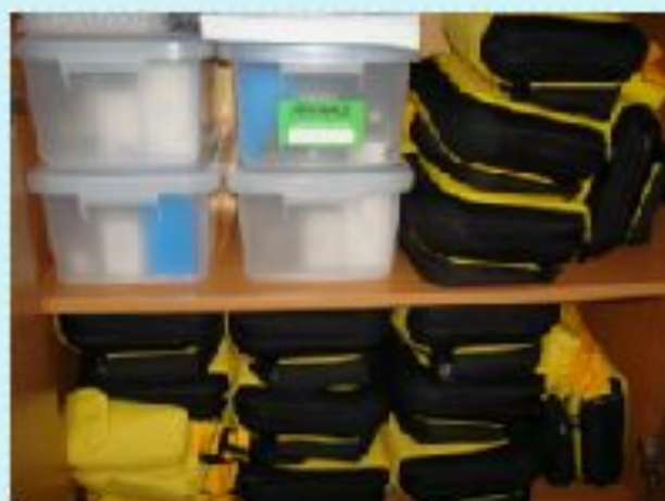
Компьютеры Nova и датчики цифровой лаборатории