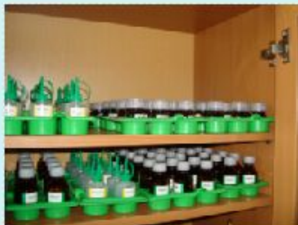
Оборудование для лабораторных опытов и практических занятий по химии