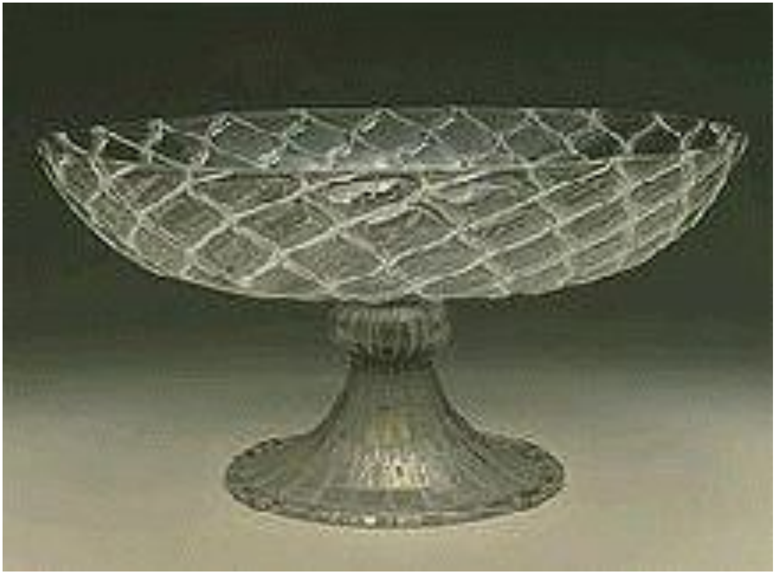
Чаша второй половины 16 века. Венеция, техника «ретичелло», то есть «сетка».