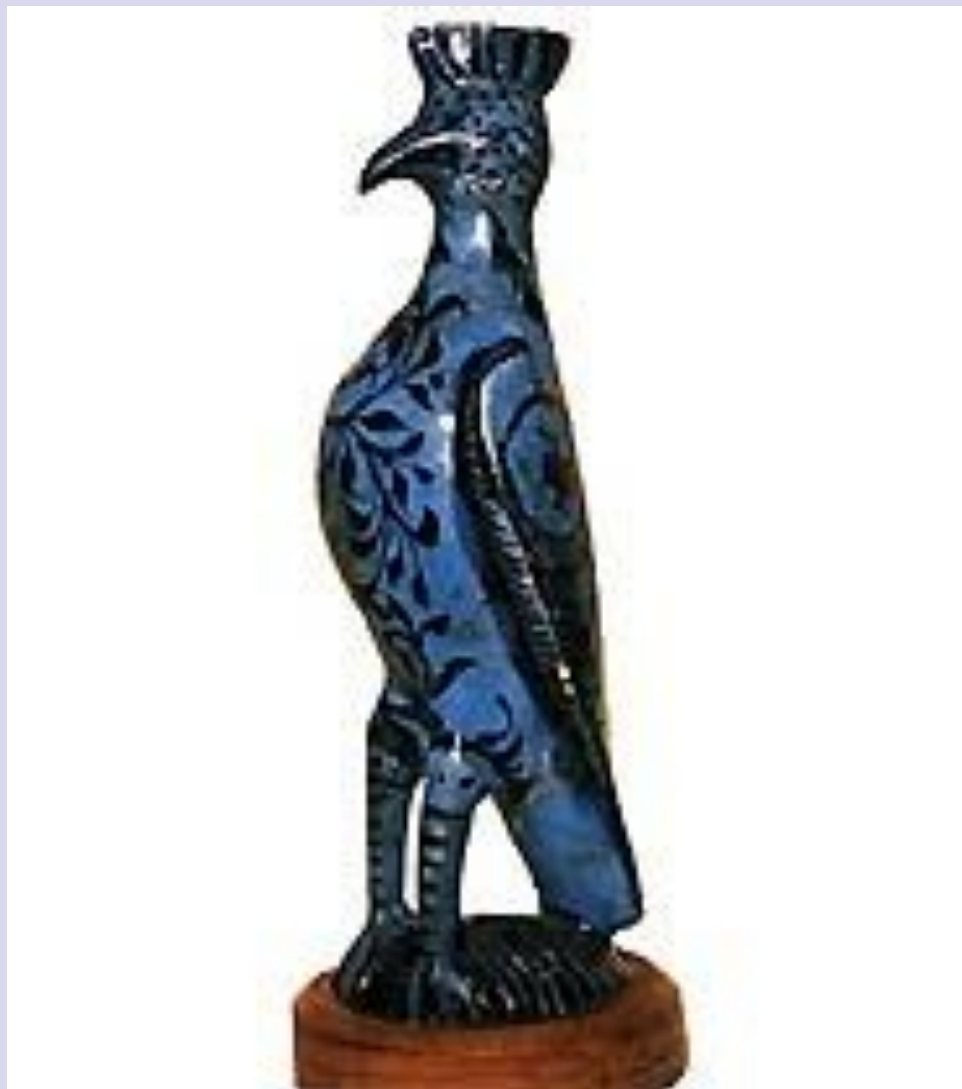
«Птица». Музей исламского искусства. Каир.