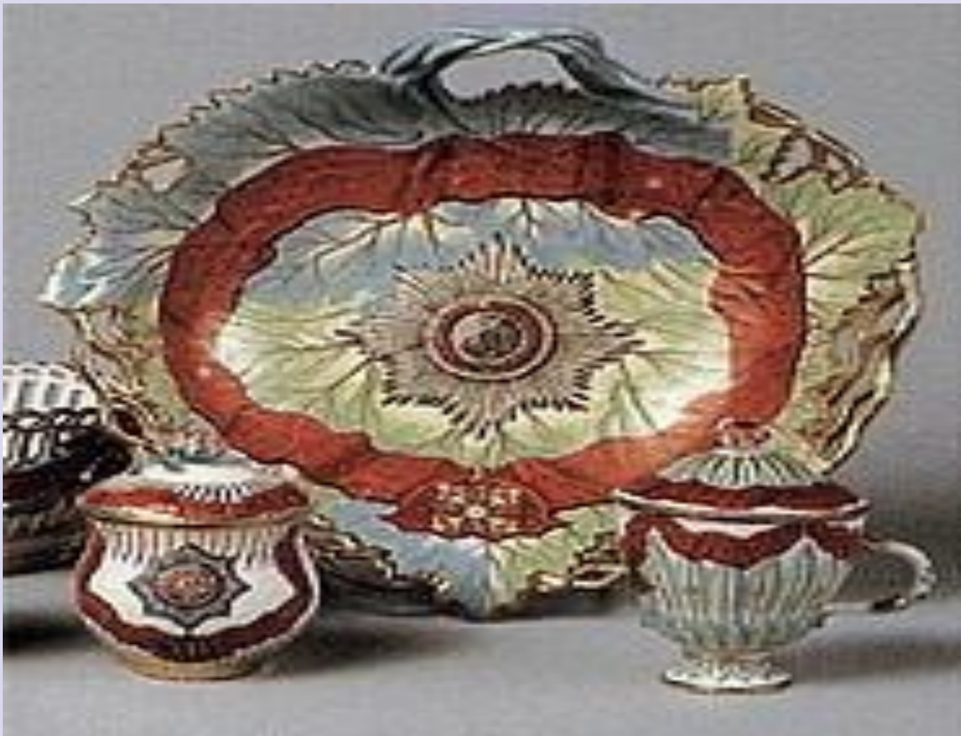
Предметы сервиза ордена Александра Невского. Завод Ф. Гарднера. 1778-1780-е годы. Фарфор. Надглазурная роспись.