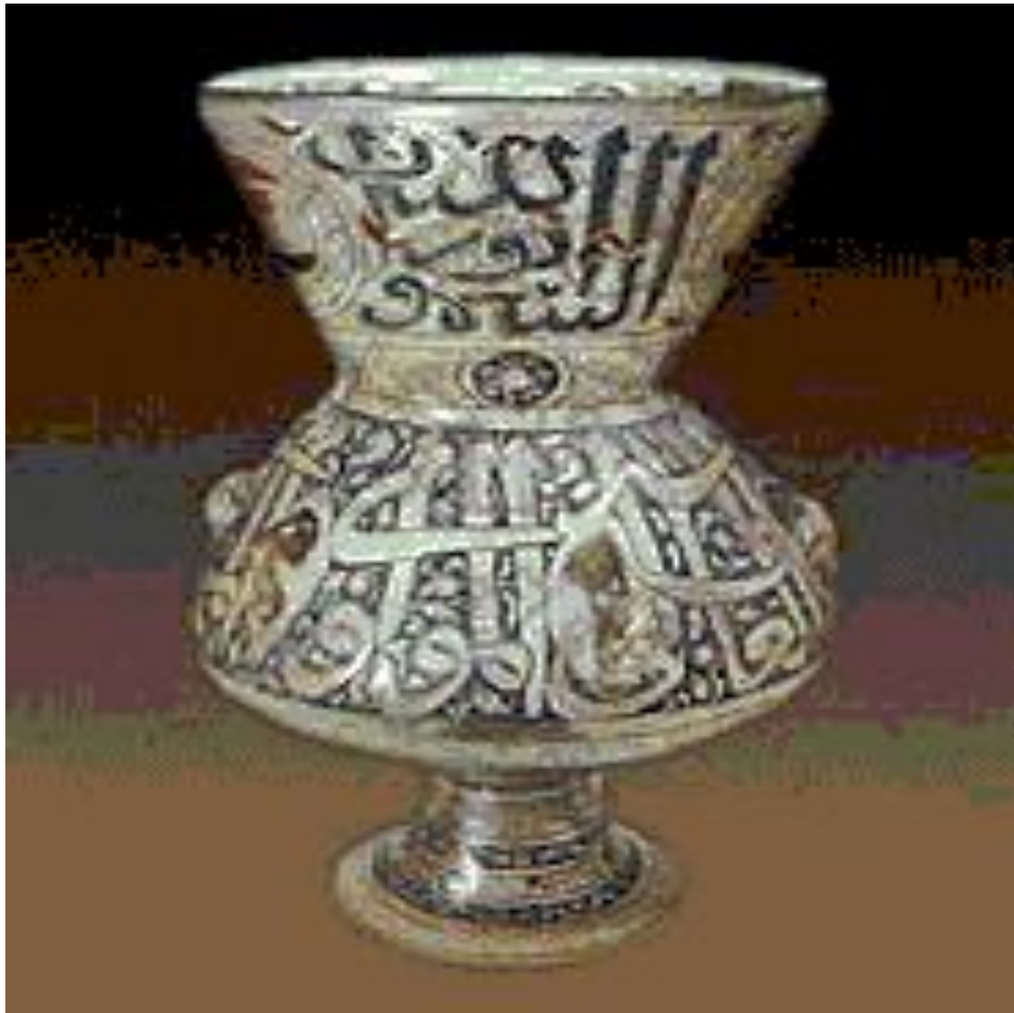
Дамасская лампа 14 века