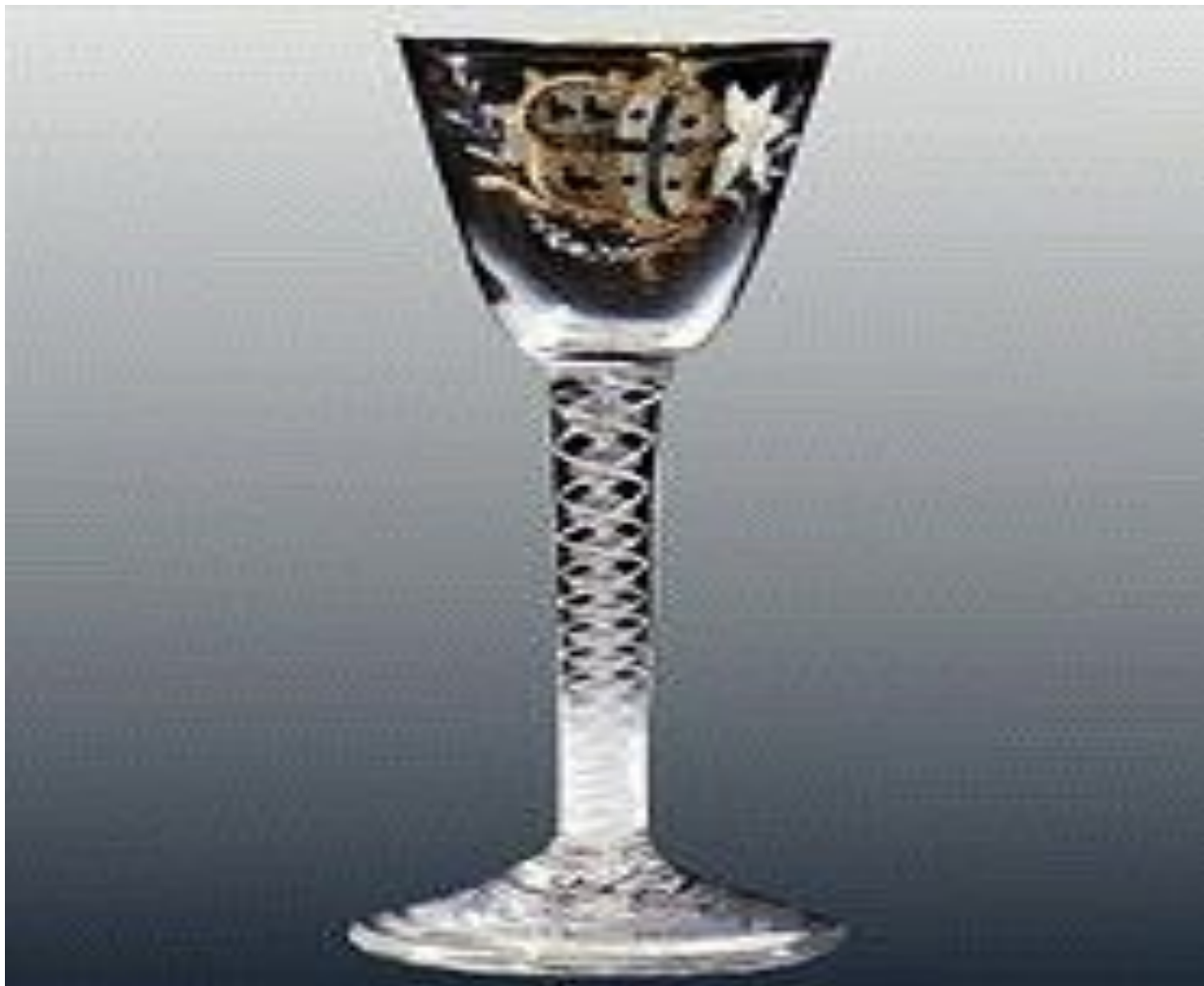
Английский бокал с гербом с эмалевой росписью в стиле рококо. 1770-е годы.