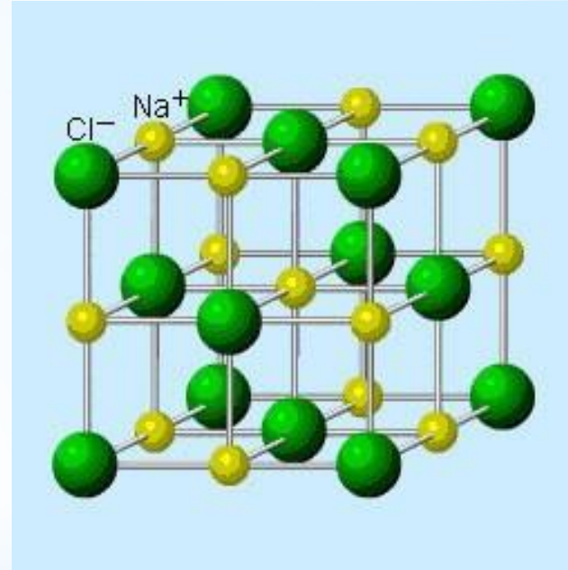
Кристаллическая решетка NaCl