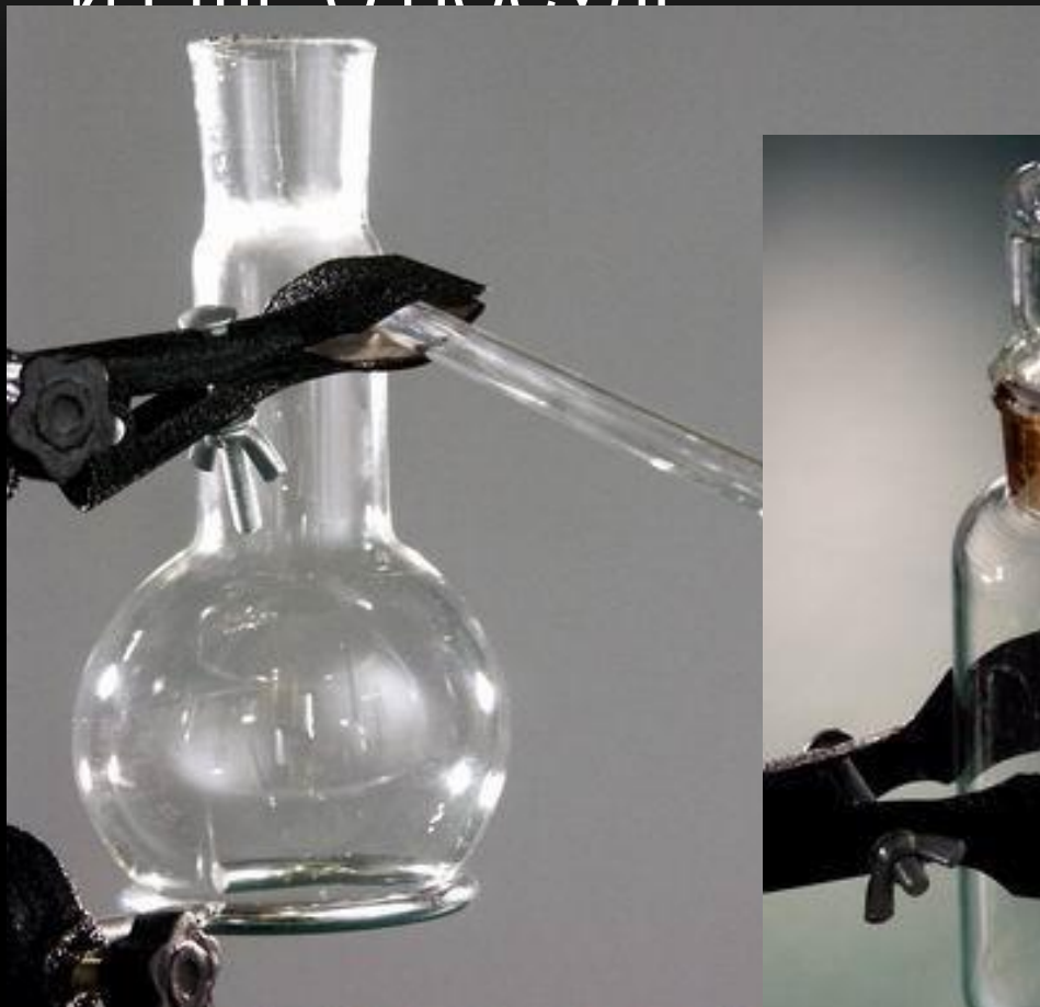
колба Вюрца перегонная