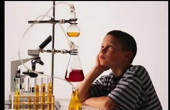
штатив для пробирок