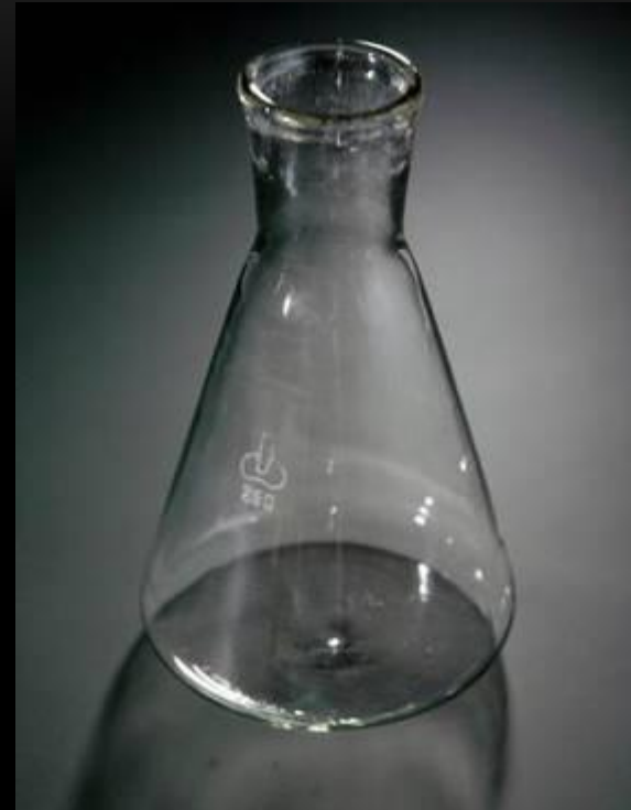
Колба Кьёльдаля коническая