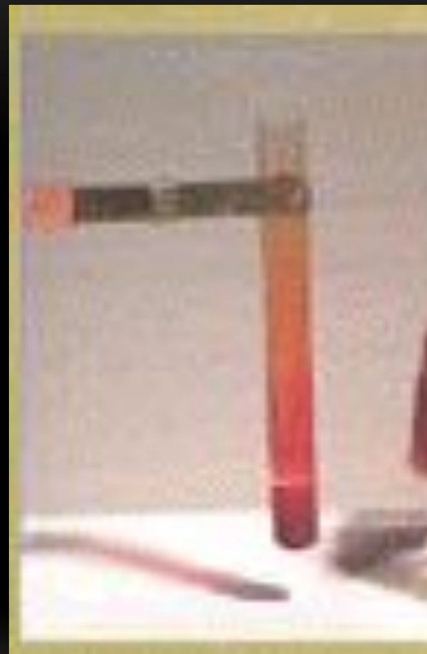
Держатель для пробирок