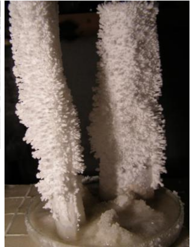
Необычные кристаллы поваренной соли - "искусственные кораллы"