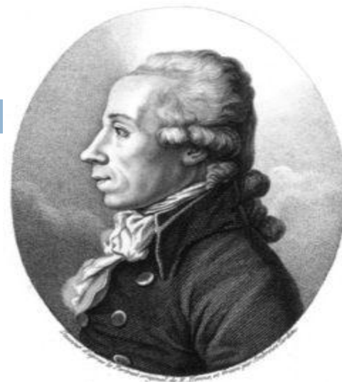
Мартин Генрих Клапрот

В свободном виде стронций первым выделил английский химик и физик Гемфри Дэви в 1808. Металлический стронций был получен при электролизе его увлажненного гидроксида. Выделявшийся на катоде стронций соединялся с ртутью, образуя амальгаму. Разложив амальгаму нагреванием, Дэви выделил чистый металл.