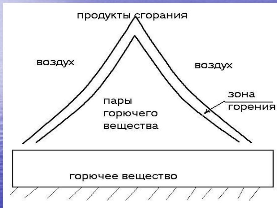
Рис. Строение ламинарного пламени

Горение твердых веществ. В условиях большинства пожаров горят твердые вещества, которые широко используются в различных отраслях и быту. К ним относятся органические и неорганические вещества и материалы.