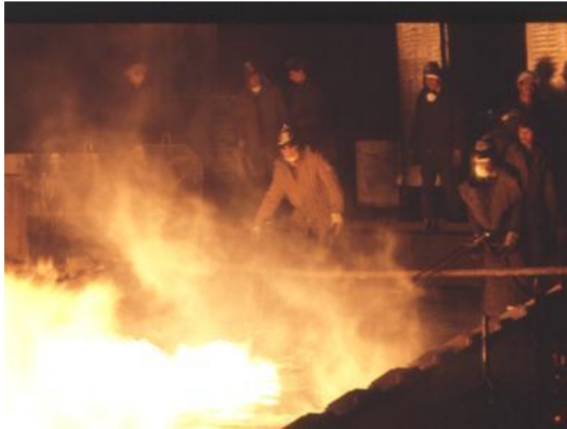
Саянский алюминиевый комбинат