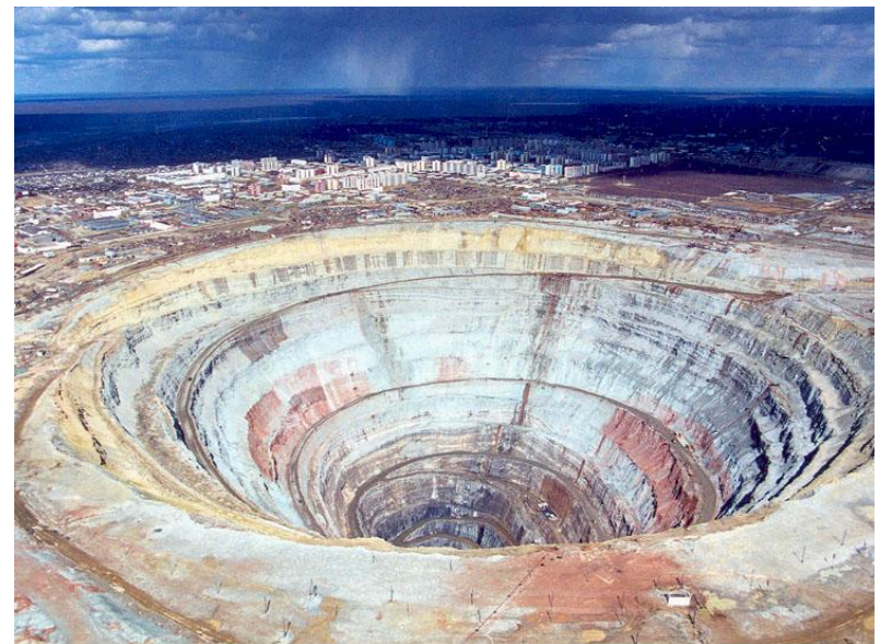
Кимберлитовая трубка “Мир” диаметр 1 500 м, глубина 500 м