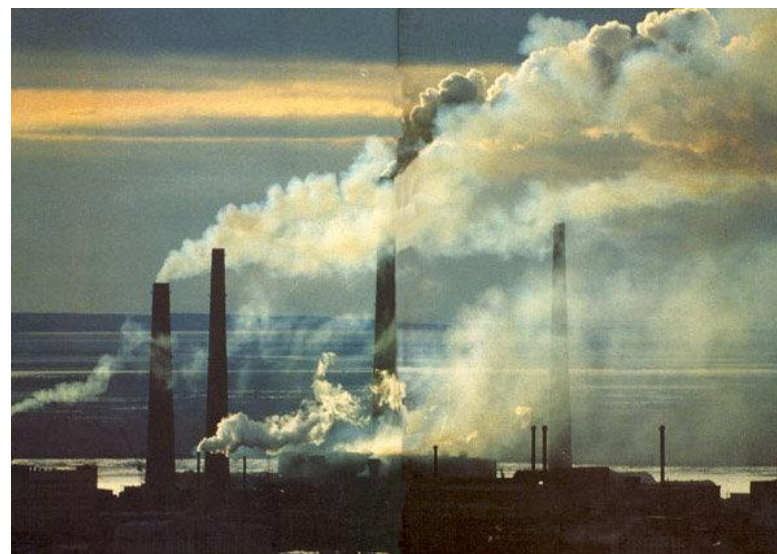
Норильский горно-металлургический комбинат