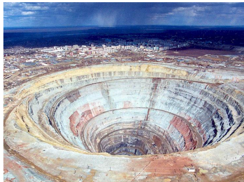
Кимберлитовая трубка “Мир” диаметр 1 500 м, глубина 500 м