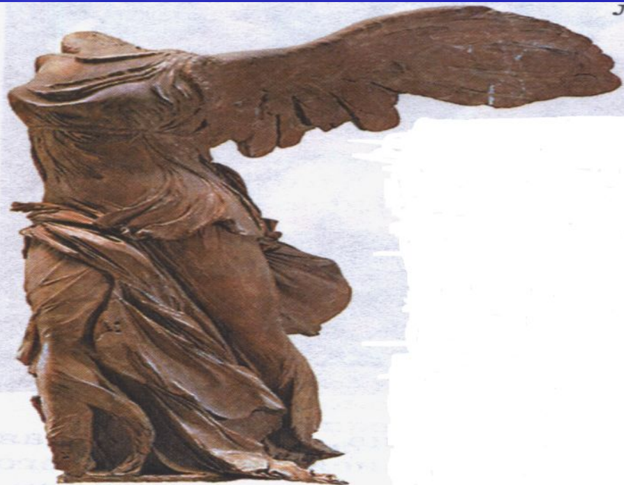
Ника Самофракийская (11 век до н.э. Лувр. Париж)