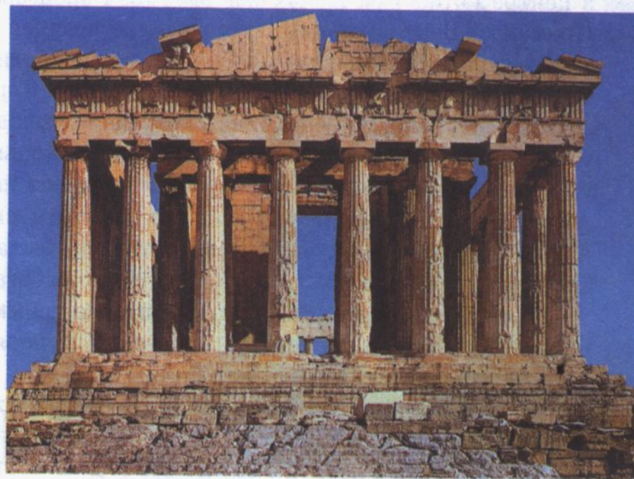
Парфенон (5 век до н.э. Афины)