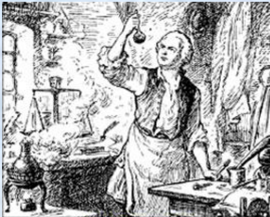
М.В.Ломоносов в своей лаборатории

В 1756 году в химической лаборатории Ломоносов провел серию опытов по кальцинации (прокаливанию) металлов, о которых писал: «...деланы опыты в заплавленных накрепко стеклянных сосудах, чтобы исследовать, прибывает ли вес от чистого жару; оными опытами нашлось, что славного Роберта Бойля мнение ложно, ибо без пропущения внешнего воздуха вес сожженного металла остается в одной мере...».