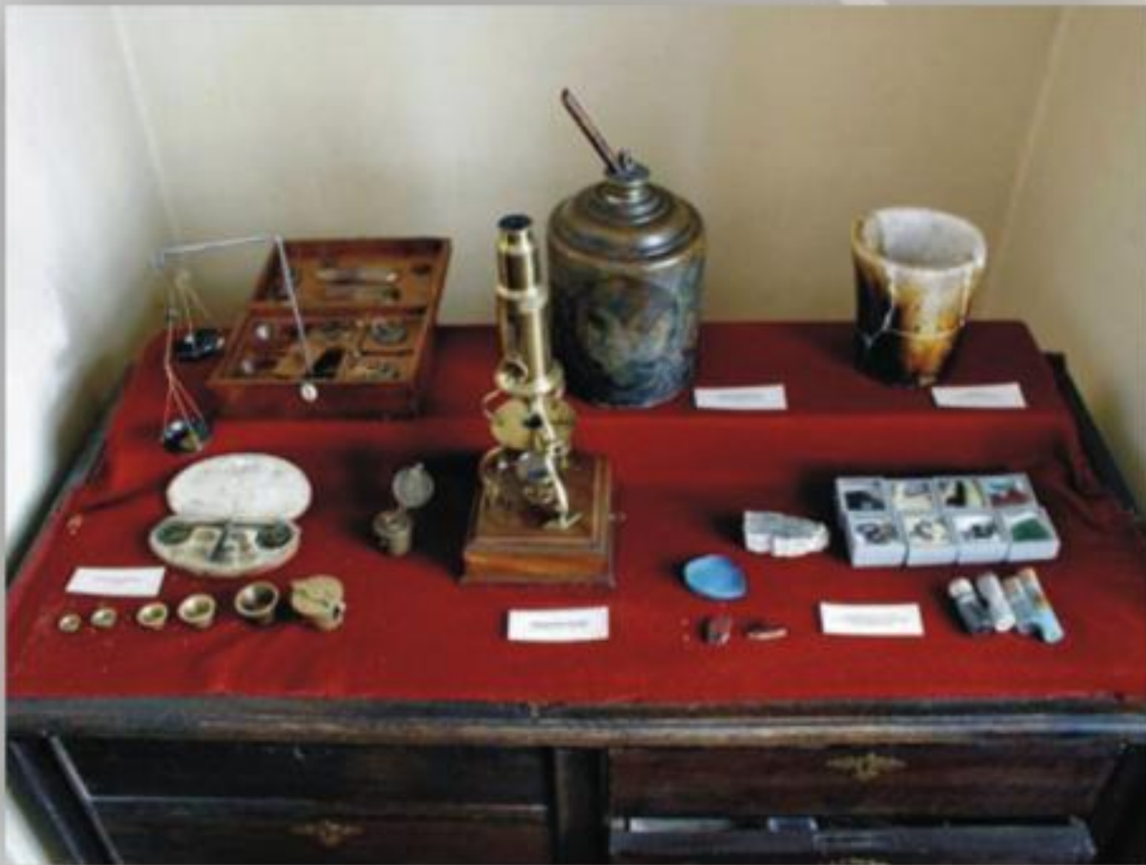
Стол химика. Экспонаты химической лаборатории М.В. Ломоносова