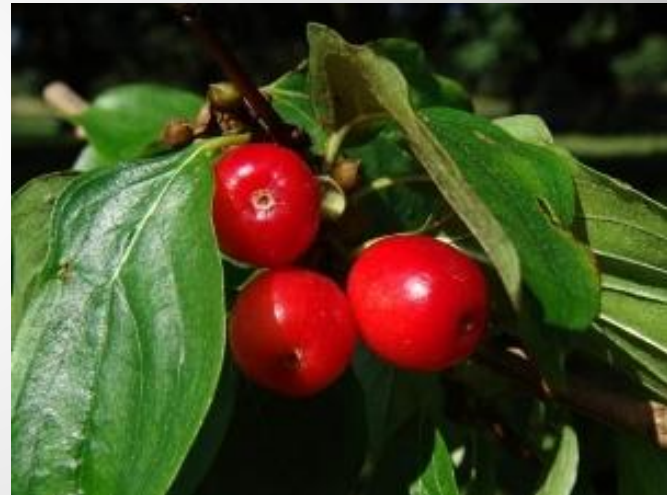
Молочне дерево або бросіум корисний ( Brosimum utile )

Молочне дерево виділяє молочний сік, але на відміну від молочних соків інших рослин, він не отруйний, а цілком їстівний і смачний. При кип'яченні на його поверхні виділяється віск, що йде на виготовлення свічок і жувальної гумки