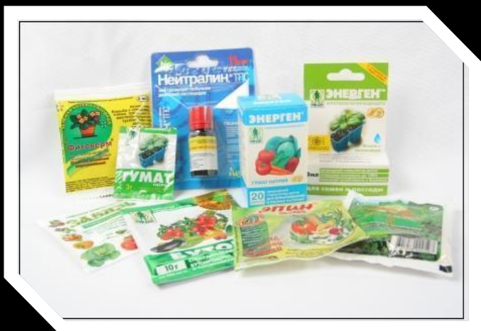
Средства защиты растений