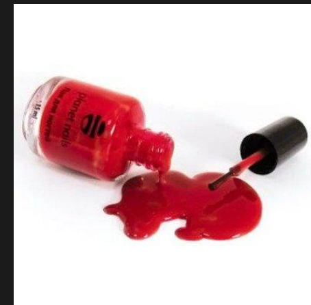
Лаки и красящие средства