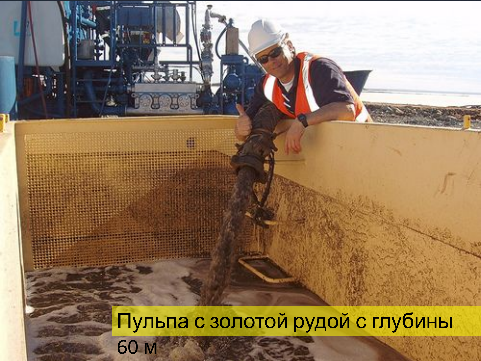
Пульпа с золотой рудой с глубины 60 м