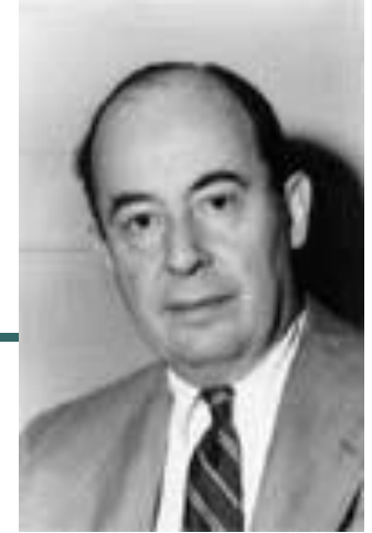
Схема устройства компьютера впервые была предложена в 1946 году этим американским ученым. Он сформулировал основные принципы работы ЭВМ, которые во многом сохранились и в современных компьютерах. Назовите учёного.