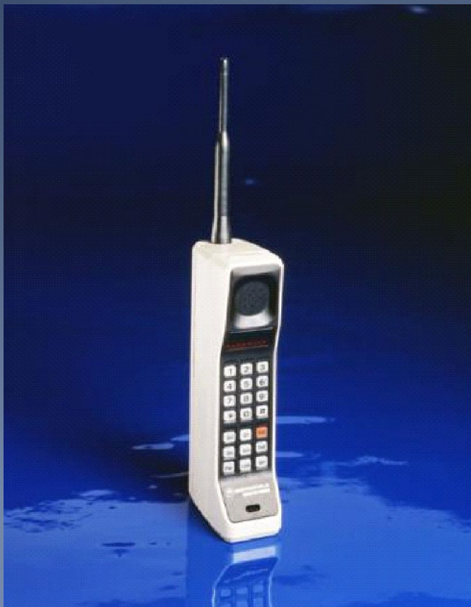
Один из первых 1

В 1946 году создала первый в мире радиотелефонный сервис: гибрид телефона и радиопередатчика