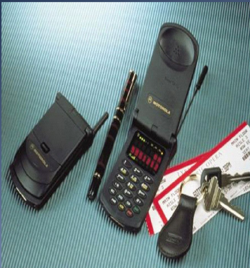
Первая в мире раскладушка 1

Компания Motorola первой начала массовый выпуск мобильных телефонов, а также телефонов-раскладушек.