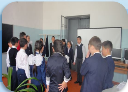
Ынтымақтастық атмосферасын қалыптастыру