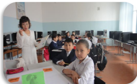
Үйге оқып үйреніп келуге: мәтінді түсініп оқу