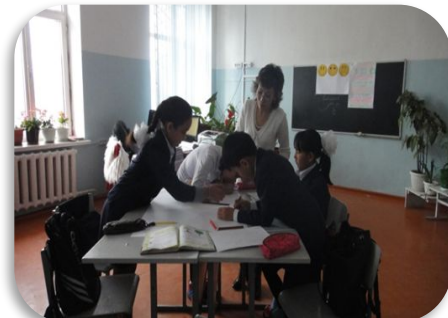
Шығармашылық тапсырма Ребус құрастыру