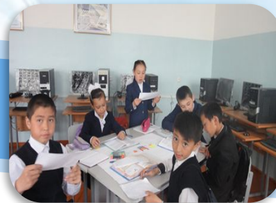
«Жалғасын тап» сөйлемді толықтыра қауымдастық құра отырып, сабақтың тақырыбын ашу