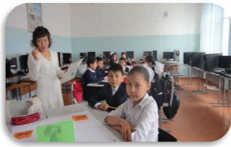
Үйге оқып үйреніп келуге: мәтінді түсініп оқу