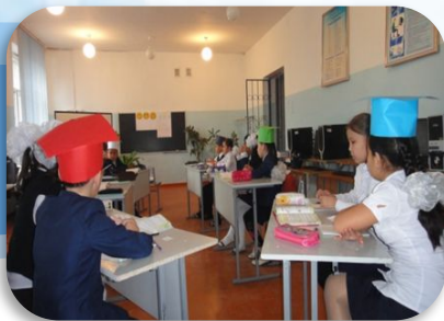
«Логиканды тексер» ойыны