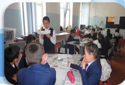
Мәтінді оқып, топ мүшелеріне түсіндіру