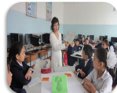
«Кім жылдам?» ойыны Сұраққа жауап беру