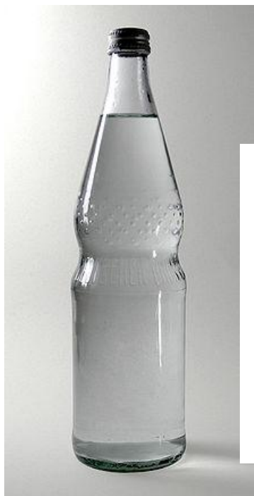
Бутылка с минеральной водой