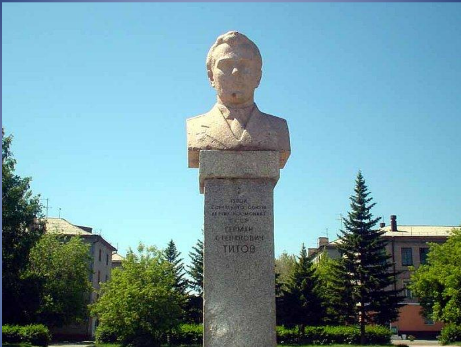
Бюст Г.С.Титова в Барнауле