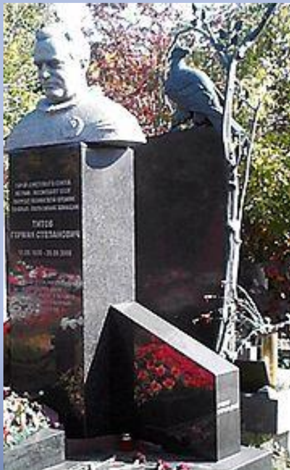
Могила на Новодевичьем кладбище в Москве

Скончался от сердечного приступа 20 сентября 2000 года в Москве. Похоронен на Новодевичьем кладбище.