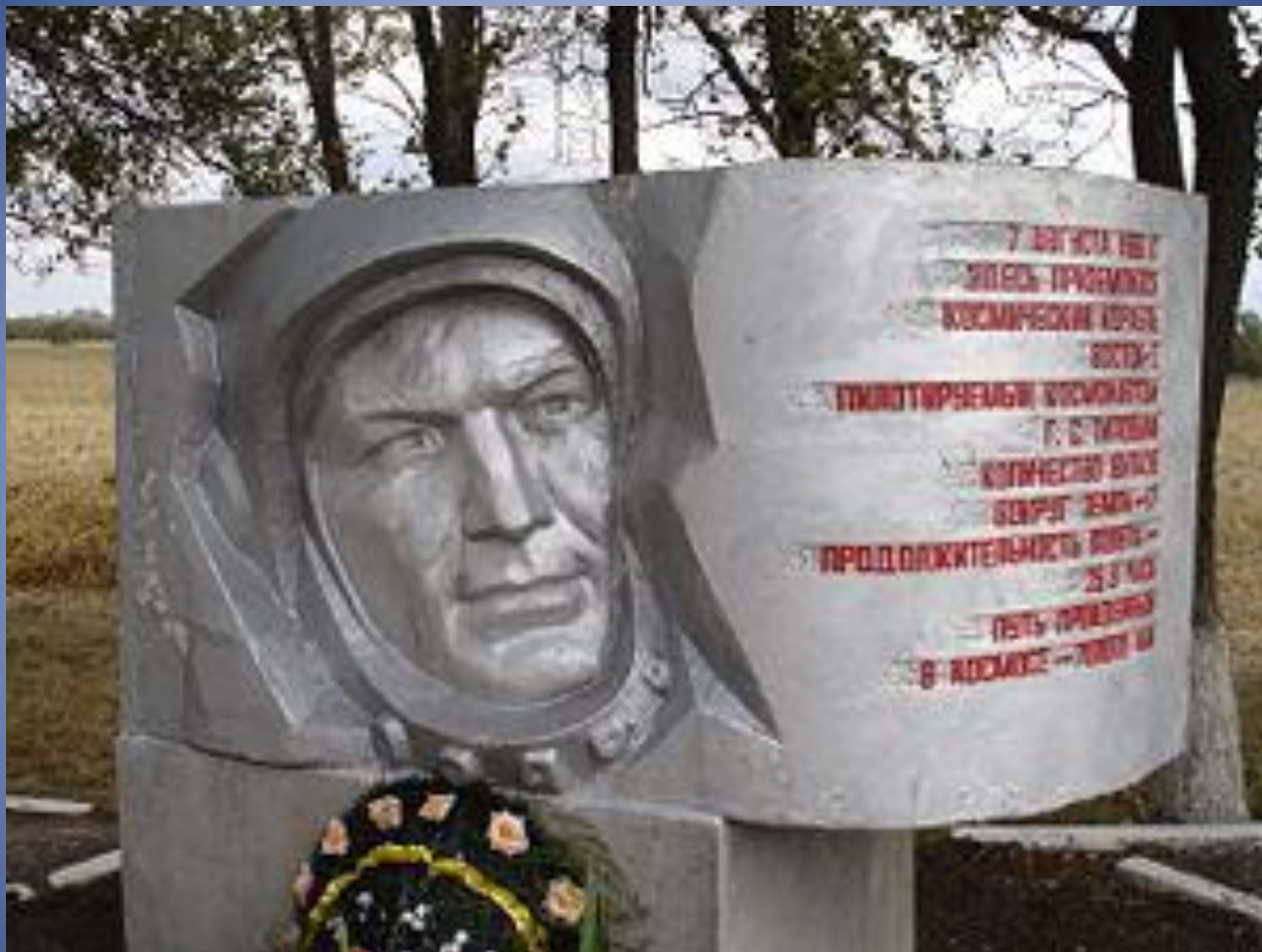
Памятник на месте приземления космического корабля «Восток-2»