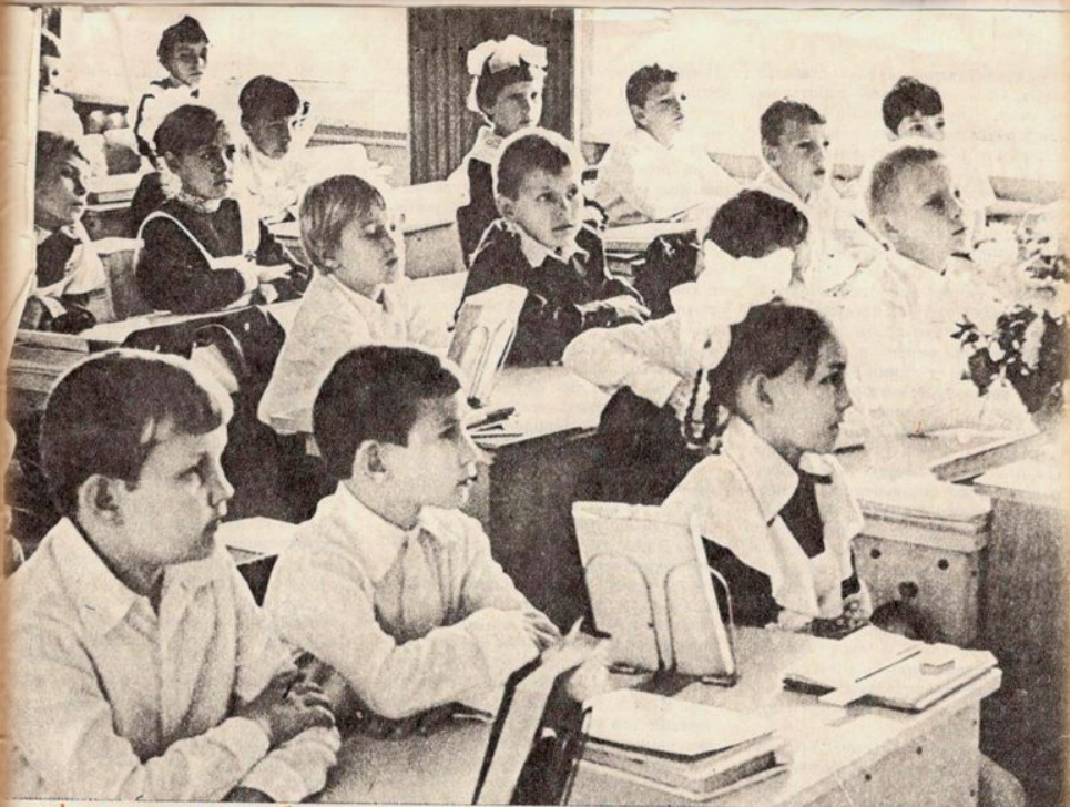
реформа школы: проблемы, опыт, размышления