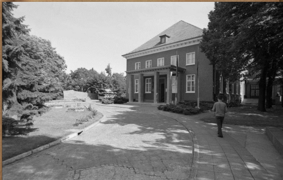
29. Juli 1991

В марте 1951 года вместе с мужем выехала в ГДР, где работала в управлении репараций Советской контрольной комиссии в Германии.