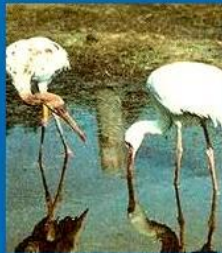
Стерхи . Окский заповедник