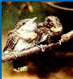
Вертишейка. Воронежский заповедник