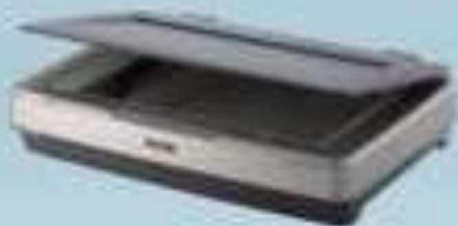
Настольный (планшетный) сканер