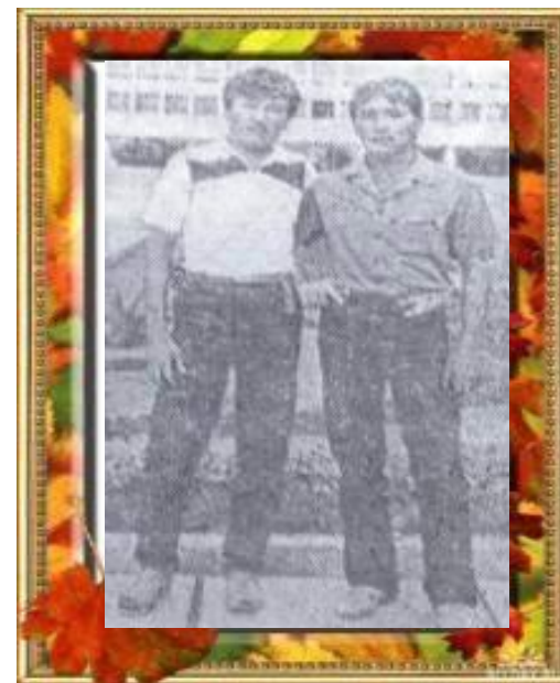
Қайраттың студенттік шағы