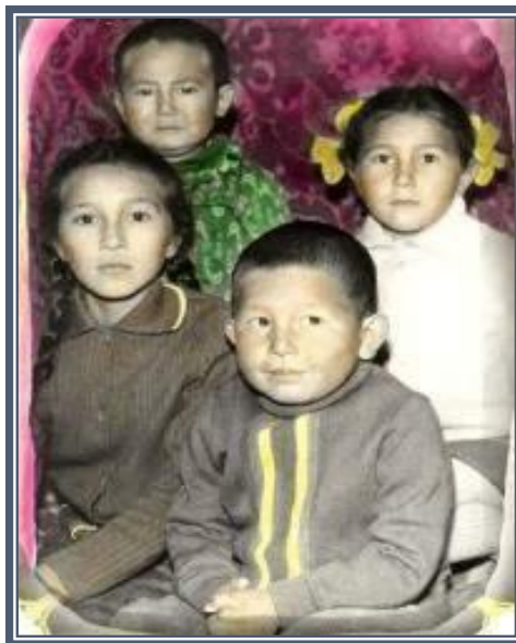
Ләззат бауырларымен бірге