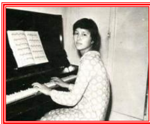
Ләззат музыкалық училищенің студенті болған кезінде 1986 жыл