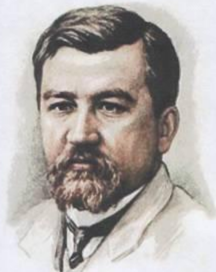
Александр Иванович Куприн