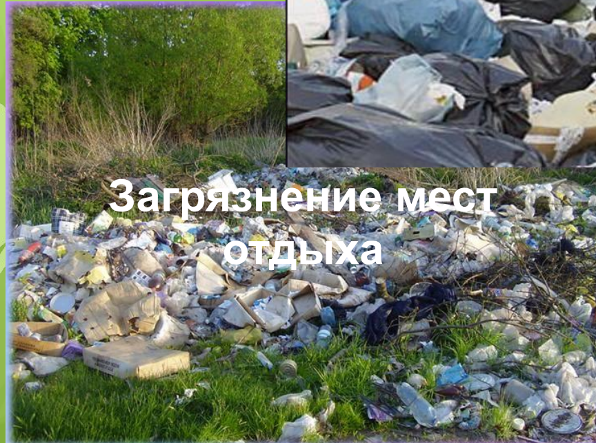
Загрязнение мест отдыха