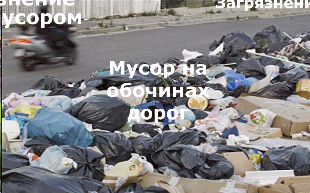
Мусор на обочинах дорог