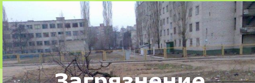
Загрязнение улиц мусором