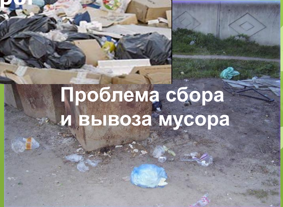
Проблема сбора и вывоза мусора