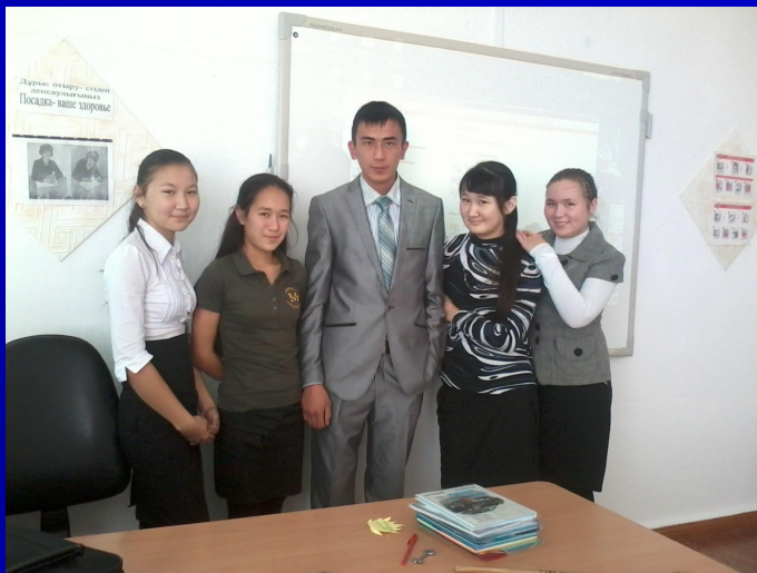
Оқушылар жеке жұмыс