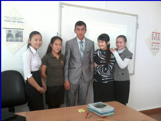
Оқушылар жеке жұмыс