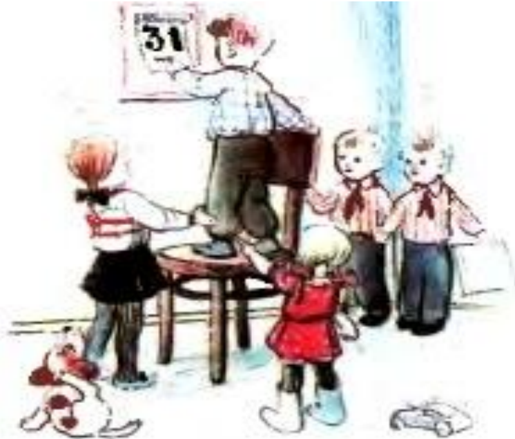
Рисунок несет образную информацию. Может ли человек, который не умеет читать, понять, о чем говорит нам рисунок?

Рассмотрите рисунок. Чьи образы вы увидели?