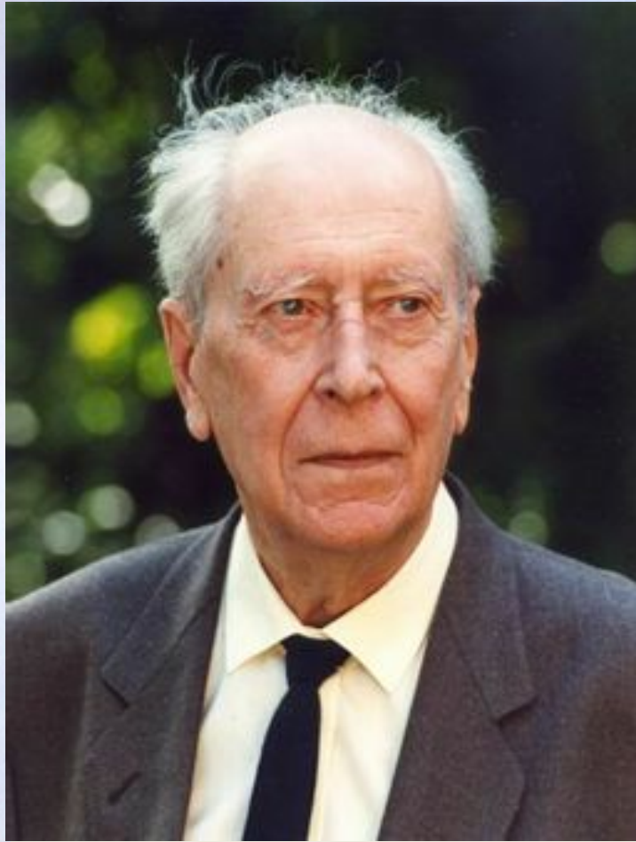
Дмитрий Сергеевич Лихачёв

Академик РАН 15 ноября 1906 30 сентября 1999