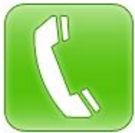
Сеть мобильной телефонной связи

Если ваш компьютер, а также компьютеры собеседников оборудованы микрофоном и наушниками, то вы можете обмениваться звуковыми сообщениями.