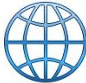
Компьютерная сеть Интернет