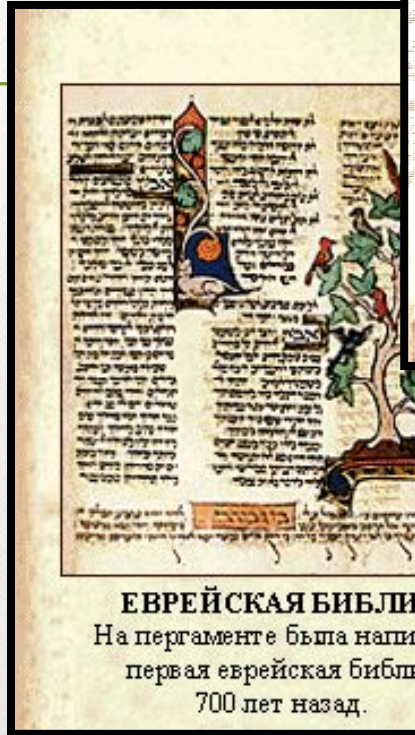
ЕВРЕЙСКАЯ БИБЛИЯ На пергаменте была написана первая еврейская Библия 700 лет назад.