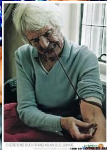
THERE'S NO SUCH THING AS AN OLD JUNKIE seen on LOTTORIE.it

Врачи считают, что Интернет-зависимость очень схожа с игровой, алкогольной и даже наркотической зависимостью