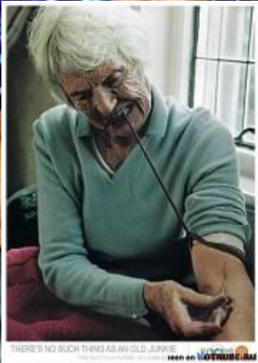
THERE'S NO SUCH THING AS AN OLD JUNKIE seen on LOTTUSSE.com

Врачи считают, что Интернет-зависимость очень схожа с игровой, алкогольной и даже наркотической зависимостью