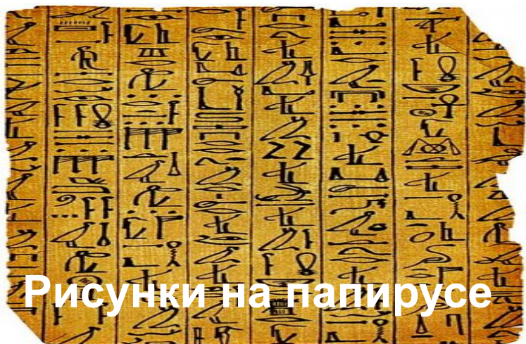
Рисунки на папирусе