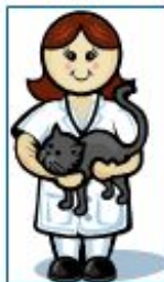
Профессия «Ветеринарный врач»