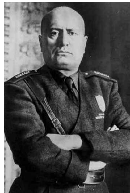
премьер-министр Италии Бенито Муссоллини