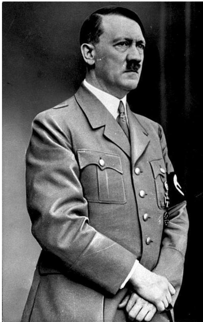
Рейхканцлер Германии Адольф Гитлер