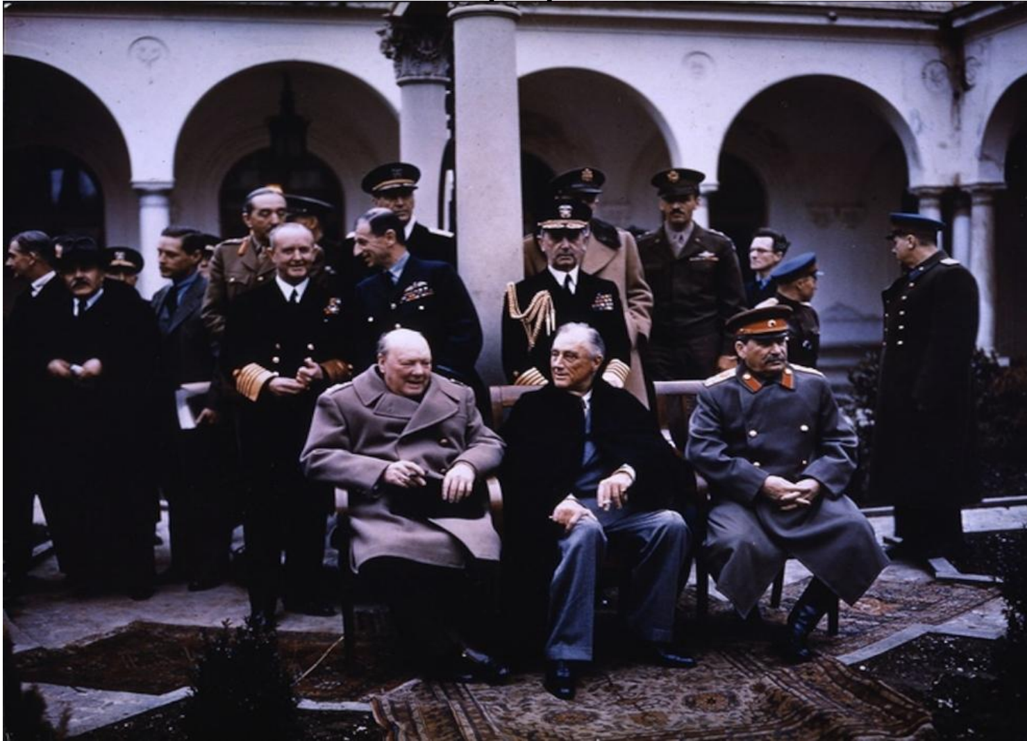
Ф. Д. Рузвельт (США), У. Черчилль (Великобритания) и И.В. Сталин (СССР)