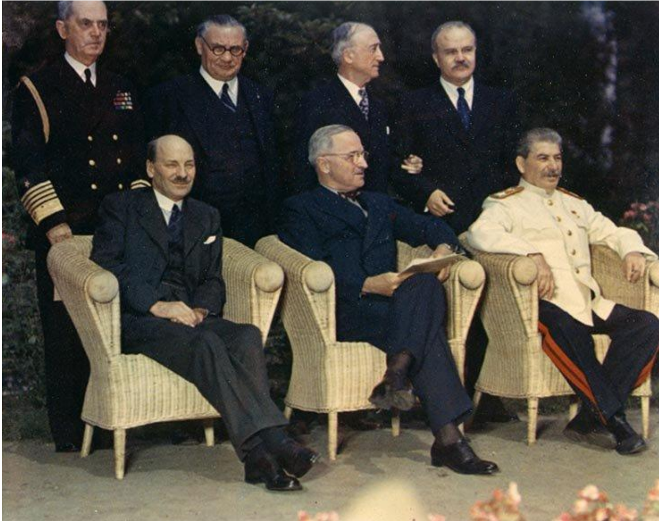
Г. Трумэн (США), К. Эттли (Великобритания ) и И.В. Сталин (СССР)