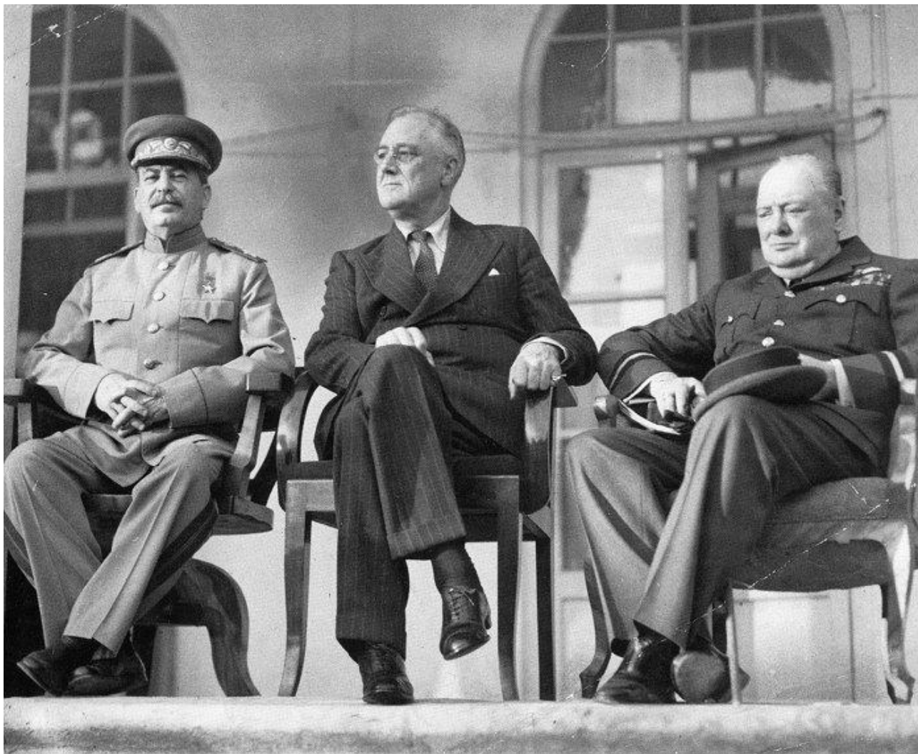
Ф. Д. Рузвельт (США), У. Черчилль (Великобритания) и И.В. Сталин (СССР)