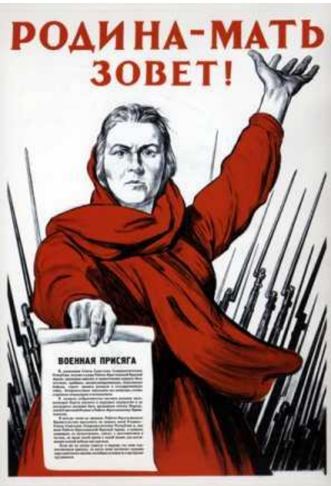
И.Тоидзе. «Родина – мать зовёт!» Плакат. 1941 г.

Успех советских войск под Москвой побуждает советское командование перейти в широкомасштабное наступление. 8 января 1942 года силы Калининского, Западного и Северо-Западного фронта переходят в наступление против немецкой группы армий «Центр». Им не удаётся выполнить поставленной задачи, и после нескольких попыток, к середине апреля, приходится прекратить наступление, понеся большие потери. Немцы сохраняют Ржевско-Вяземский плацдарм, представляющий опасность для Москвы. Попытки Волховского и Ленинградского фронтов деблокировать Ленинград также не увенчались успехом и привели к окружению в марте 1942 года части сил Волховского фронта.