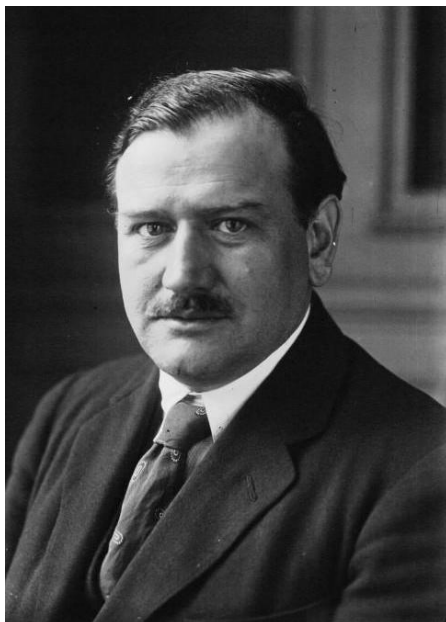
премьер-министр Франции Эдуард Деладье