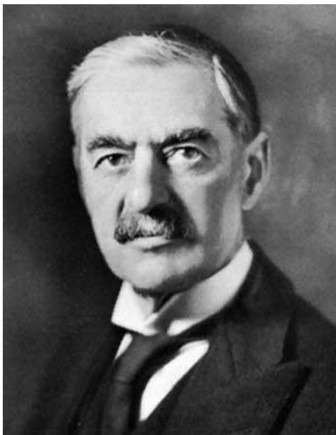
премьер-министр Великобритании Невилл Чемберлен