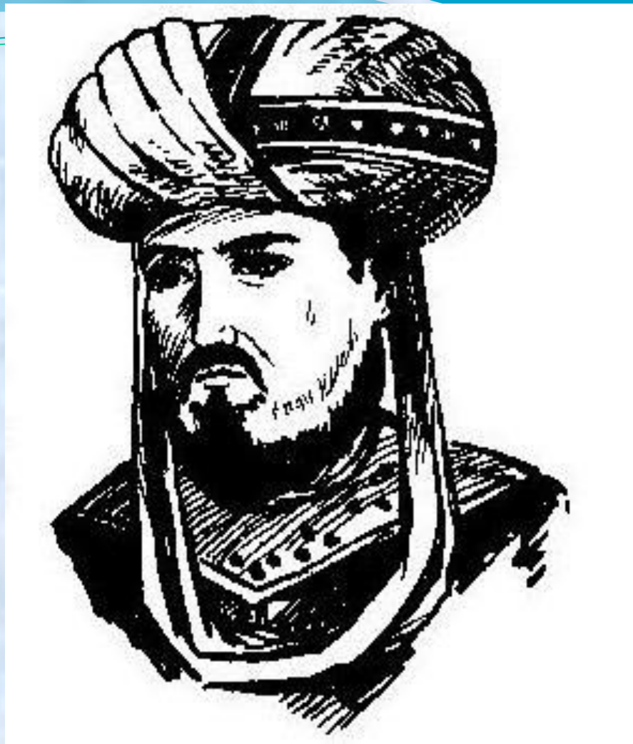
Мухаммед Бен Мусса аль-Хорезми (787 – ок.850)

Портрет взят из учебника «Алгебра 7» под редакцией С. А. Теляковского