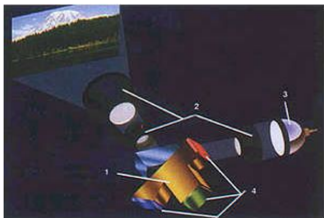
Устройство DLP-проектора с тремя матрицами

С появлением телевизоров на жидких кристаллах (ЖК) у разработчиков возникла остроумная мысль использовать ЖК-матрицу как основной элемент в прямом проекторе.