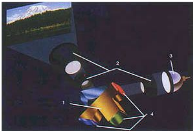
Устройство DLP-проектора с тремя матрицами

С появлением телевизоров на жидких кристаллах (ЖК) у разработчиков возникла остроумная мысль использовать ЖК-матрицу как основной элемент в прямом проекторе.