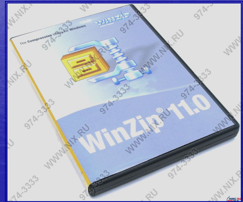
Диск с архиватором

Многие архиваторы используют сжатие без потерь для уменьшения размера архива.