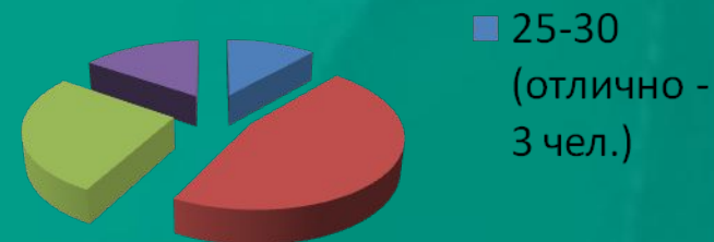
Количество правильных ответов (из 30 вопросов)