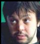
Швыдкой Сергей Михайлович