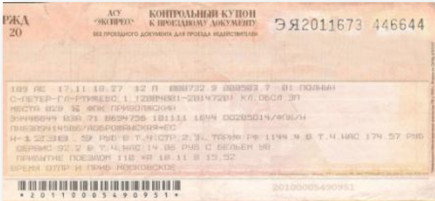
2 слип «Контрольный купон»