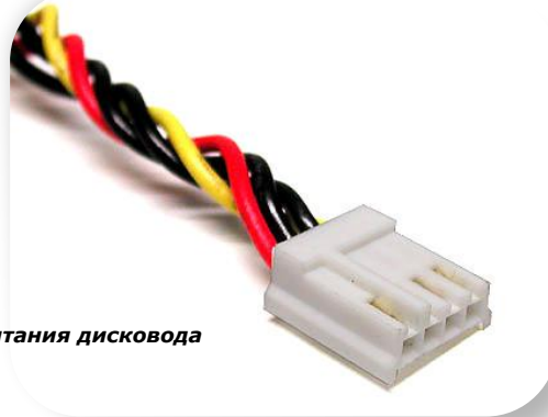
разъем питания дисковода