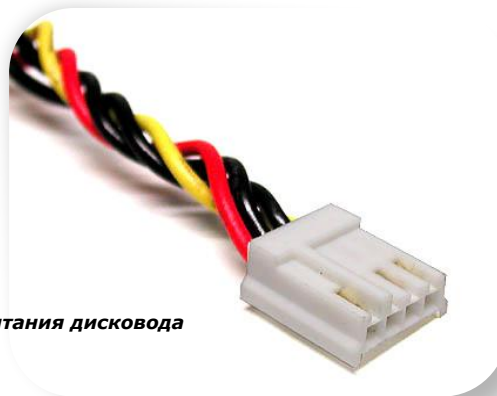
разъем питания дисковода