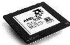
5k86 (166 МГц)